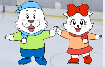
キャプテンわん

初心者対象です！ 滑れる方のクラスは ありません。 お申込み前に ご確認ください！