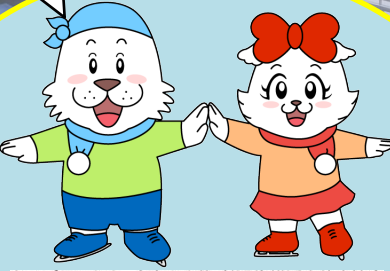
キャプテンわん

アイススケートに興味のある方、「習い事にアイススケートを」、とお考えの方のために、小学生以上を対象にした「初心者アイススケート体験教室」を開催いたします。定期教室に入る前に、一度ご体験してみたいかがでしょうか？靴の履き方からご指導いたします。この機会にぜひお申し込みください。